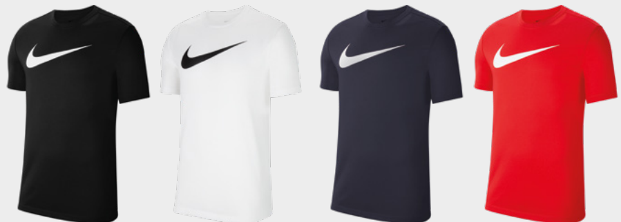
Erw. CW6936-010 Kids CW6941-010 Schwarz / (Weiß)