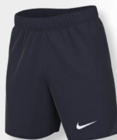
Erw. FD7605-451 Obsidian / (Weiß)