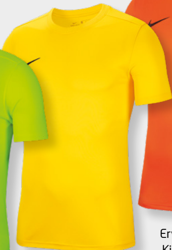
Erw. BV6708-719 Kids BV6741-719 Tour Yellow / [Black]