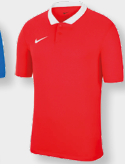
Erw. CW6933-657 University Red / White / [White]