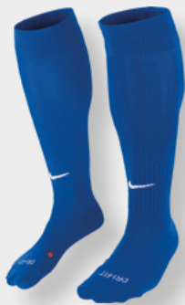
Erw. SX5728-463 Royal Blue / (White)