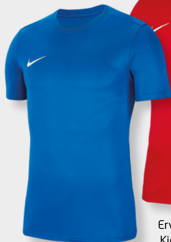
Erw. BV6708-463 Kids BV6741-463 Royal Blue / [White]