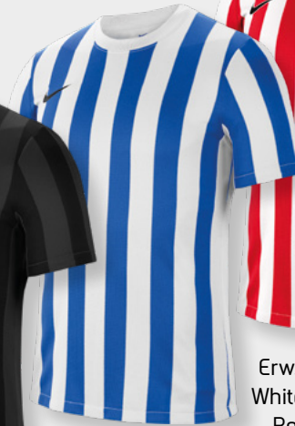
Erw. CW3813-102 White / Royal Blue / (Black)