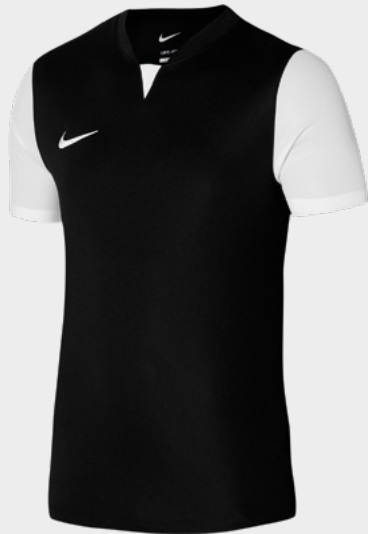
Erw. DR0933-010 Schwarz / Weiß / Weiß / (Weiß)