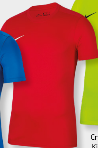
Erw. BV6708-657 Kids BV6741-657 University Red / [White]