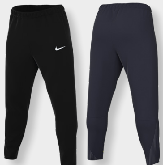
Erw. FD7672-010 Schwarz / (Weiß)