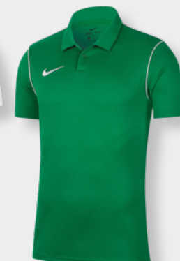
Erw. BV6879-302 Pine Green / White / [White]