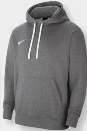
Erw. CW6894-071 Kids CW6896-071 Charcoal Heather / White / [White]