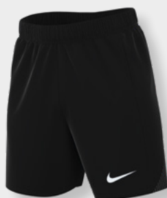
Erw. FD7605-010 Schwarz / (Weiß)