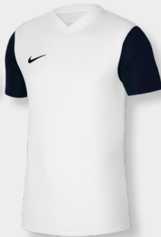
Erw. DH8035-100 Kids DH8389-100 Weiß / Schwarz / [Schwarz]Red