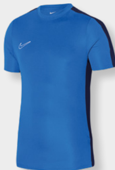
Erw. DR1336-463 Kids DR1343-463 Royal Blue / Obsidian / (Weiß)