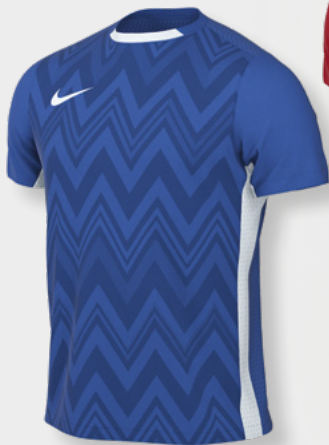
Erw. FD7412-463 Royal Blue / Capri / (Weiß)