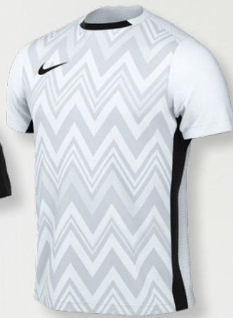
Erw. FD7412-100 Weiß / Schwarz / (Schwarz)