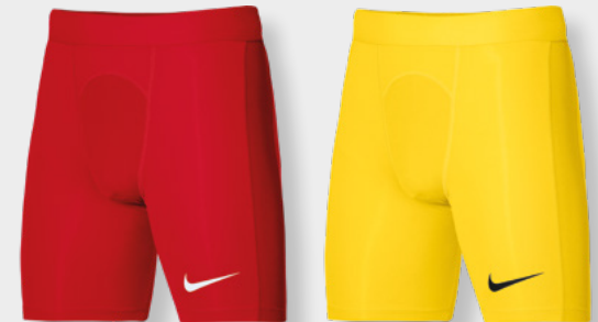
Erw. DH8128-657 University Red / (Weiß)