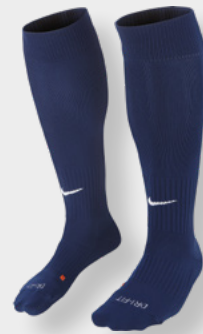
Erw. SX5728-411 Midnight Navy / (White)