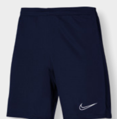
Erw. DR1360-451 Kids DR1364-451 Obsidian / White / White / (White)