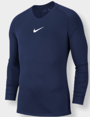
Erw. AV2609-410 Midnight Navy / (Weiß)