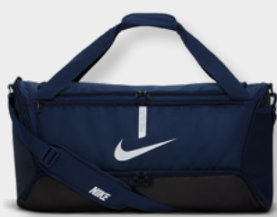
M CU8090-410 L CU8089-410 Midnight Navy / Black / (White)