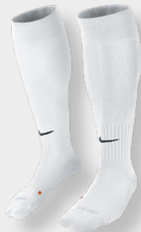
Erw. SX5728-100 White / (Black)