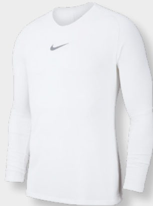
Erw. AV2609-100 Weiß / (Cool Grey)