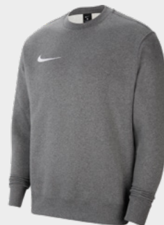
Erw. CW6902-071 Kids CW6904-071 Charcoal Heather / [Weiß]