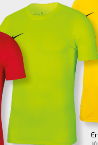
Erw. BV6708-702 Kids BV6741-702 Volt / [Black]