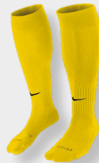
Erw. SX5728-719 Tour Yellow / (Black)