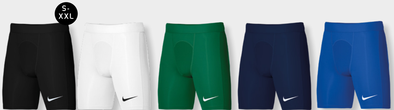
Erw. DH8128-010 Schwarz / (Weiß)

STRIKE PRO SHORTS Herren Shorts S-XL € 29,99