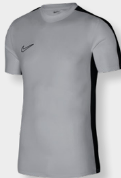
Erw. DR1336-012 Kids DR1343-012 Wolf Grey / Schwarz / Weiß