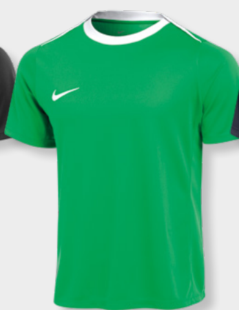
Erw. FD7592-329 Green Spark / Weiß (Weiß)