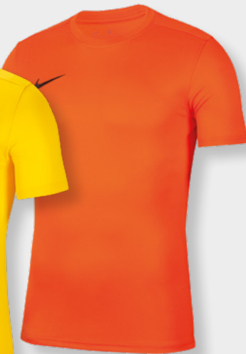
Erw. BV6708-819 Kids BV6741-819 Safety Orange / [Black]