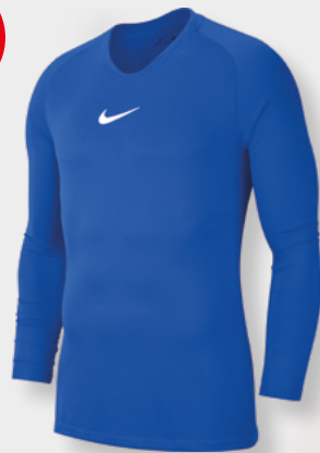
Erw. AV2609-463 Royal Blue / (Weiß)