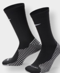
Erw. DH6620-010 FZ8485-010 Schwarz / (Weiß)