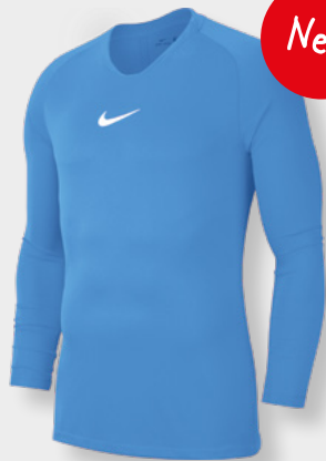
Erw. AV2609-412 University Blue / (Weiß)