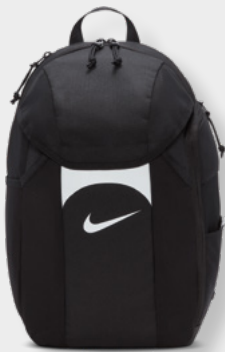
DV0761-011 Black / Black / [White]