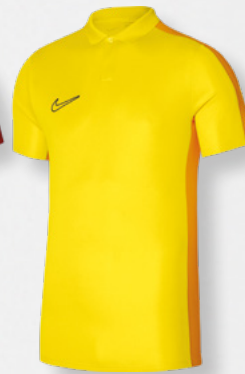
Erw. DR1346-719 Tour Yellow / Univer- sity Gold / [Schwarz]