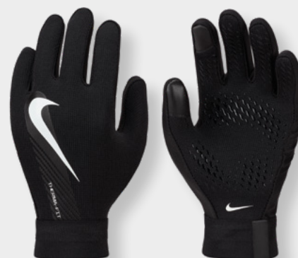
Erw. DQ6071-010 Kins DQ6066-010 Black / Black / (White)