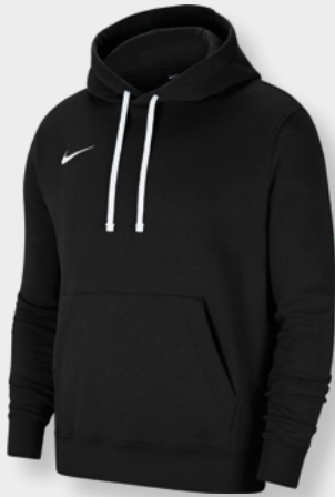
Erw. CW6894-010 Kids CW6896-010 Black / White / [White]