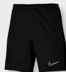
Erw. DR1360-010 Kids DR1364-010 Black / White / White / (White)