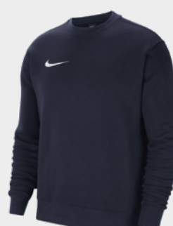
Erw. CW6902-451 Kids CW6904-451 Obsidian / [Weiß]