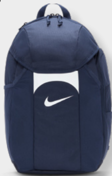
DV0761-410 Midnight Navy / Black / [White]