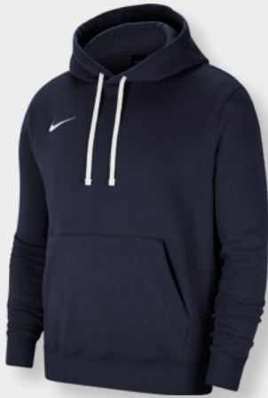
Erw. CW6894-451 Kids CW6896-451 Obsidian / White / [White]