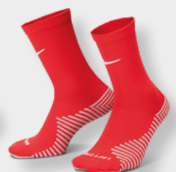
Erw. DH6620-657 FZ8485-657 University Red / (Weiß)