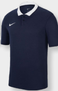
Erw. CW6933-451 Obsidian / White / [White]