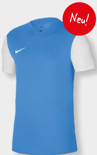
Erw. DH8035-412 Kids DH8389-412 University Blue / Weiß / Weiß