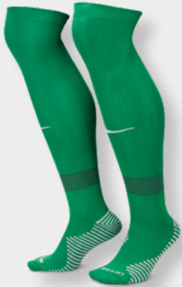
Erw. FQ8253-302 Pine Green / Gorge Green / Black / White