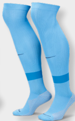
Erw. FQ8253-412 University Blue / Italy Blue / Mid