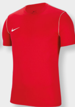
Erw. BV6883-657 Kids BV6905-657 University Red / White / [White]