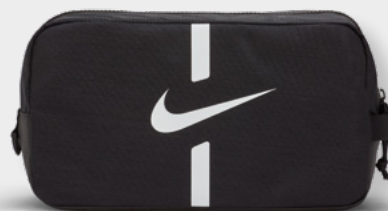
DC2648-010 Black / Black / (White)