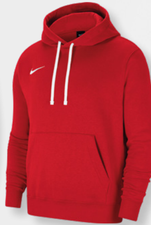
Erw. CW6894-657 Kids CW6896-657 University Red / White / [White]