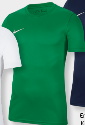
Erw. BV6708-302 Kids BV6741-302 Pine Green / [White]