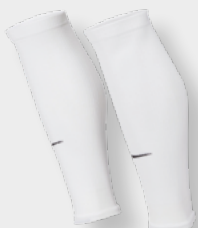
Erw. DH6621-100 Weiß / (Schwarz)