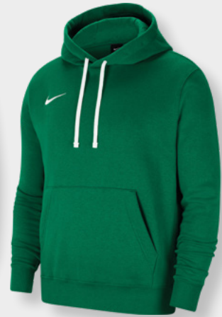
Erw. CW6894-302 Kids CW6896-302 Pine Green / White / [White]