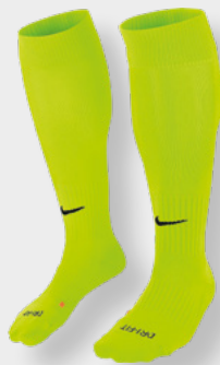
Erw. SX5728-702 Volt / (Black)