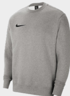
Erw. CW6902-063 Dark Grey Heather / [Schwarz]