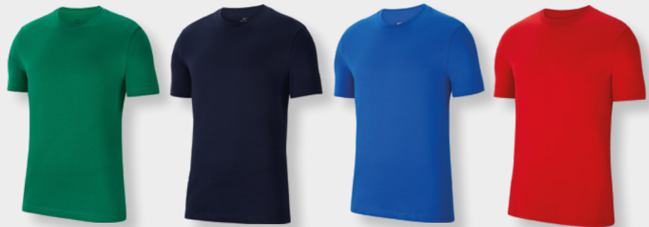
Erw. CZ0881-302 Kids CZ0909-302 Pine Green / (White)

Herren T-Shirt S-XXL € 22,99 Kinder T-Shirt S-XL € 17,99