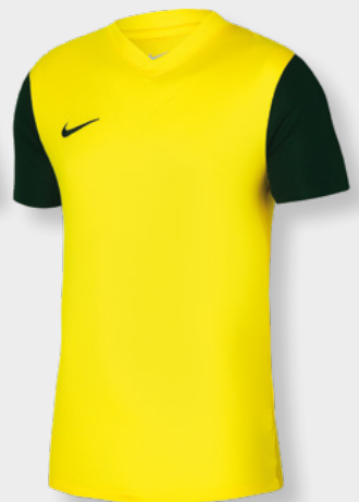
Erw. DH8035-719 Kids DH8389-719 Tour Yellow / Schwarz / [Schwarz]