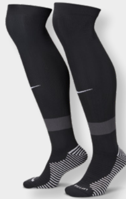
Erw. FQ8253-010 Black / Anthracite / White