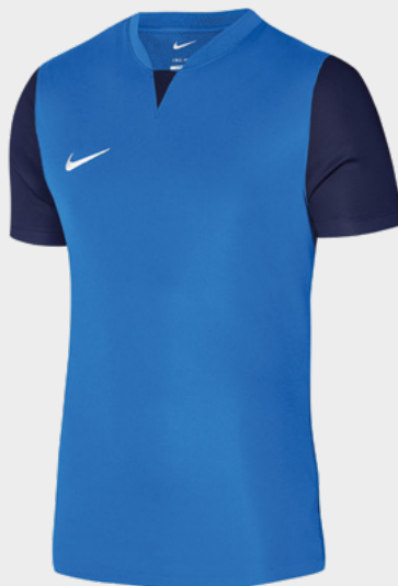
Erw. DR0933-463 Royal Blue / Midnight Navy / Midnight Navy / (White)