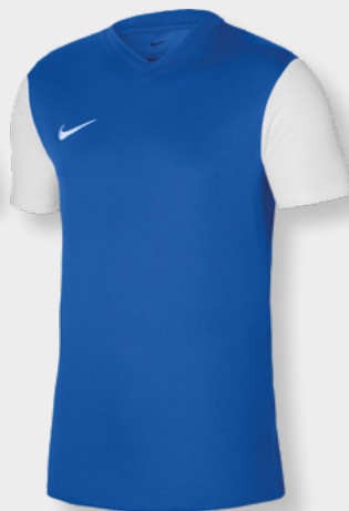
Erw. DH8035-463 Kids DH8389-463 Royal Blue / Capri / [Weiß]