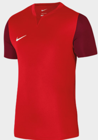
Erw. DR0933-657 University Red / Team Red / Team Red / (White)