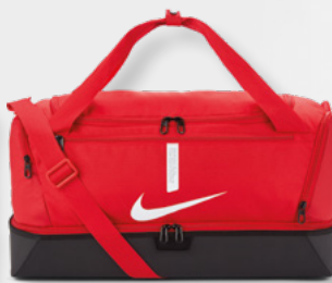
M CU8096-657 L CU8087-657 University Red / Black / (White)