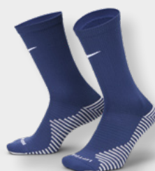
Erw. DH6620-410 FZ8485-410 Midnight Navy / (Weiß)