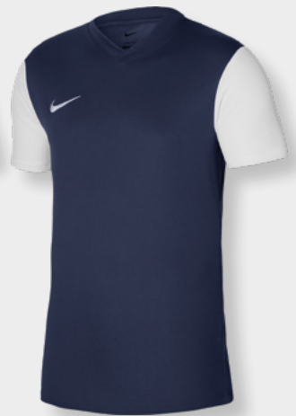
Erw. DH8035-410 Kids DH8389-410 Midnight Navy / Weiß / [Weiß]