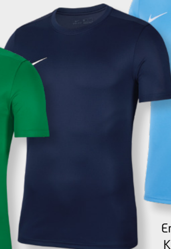
Erw. BV6708-410 Kids BV6741-410 Midnight Navy / [White]