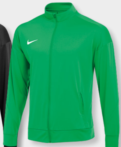
Erw. FD7681-329 Green Spark / (Weiß)