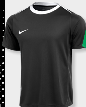
Erw. FD7592-010 Schwarz / Weiß (Weiß)