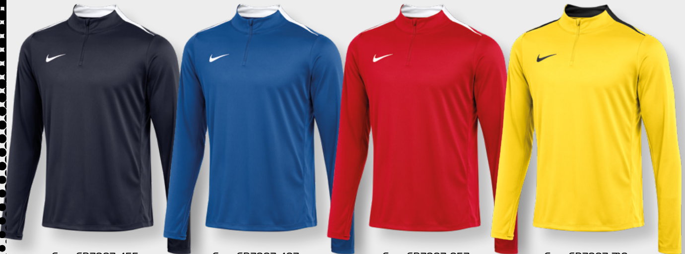
Erw. FD7667-455 Obsidian / (Weiß)