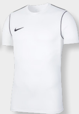
Erw. BV6883-100 Kids BV6905-100 White / Black / [Black]