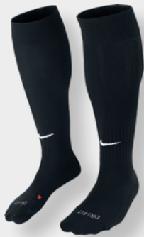
Erw. SX5728-010 Black / (White)