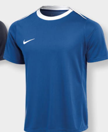
Erw. FD7592-465 Royal Blue / Weiß (Weiß)