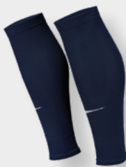
Erw. DH6621-410 Midnight Navy / (Weiß)