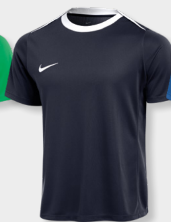
Erw. FD7592-458 Obsidian / Weiß (Weiß)