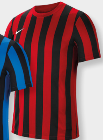
Erw. CW3813-658 University Red / Black / (White)