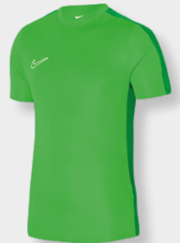
Erw. DR1336-329 Kids DR1343-329 Green Spark / Lucky Green / (White)