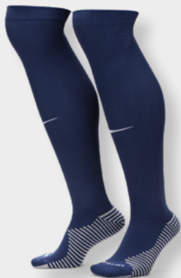
Erw. FQ8253-410 Midnight Navy / White