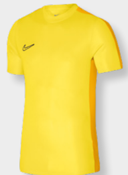
Erw. DR1336-719 Kids DR1343-719 Tour Yellow / Univer- sity Gold / (Schwarz)