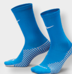
Erw. DH6620-463 FZ8485-463 Royal Blue / (Weiß)