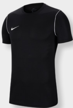
Erw. BV6883-010 Kids BV6905-010 Black / White / [White]