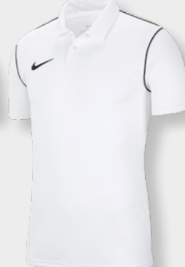
Erw. BV6879-100 White / Black / [Black]