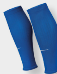
Erw. DH6621-463 Royal Blue / (Weiß)