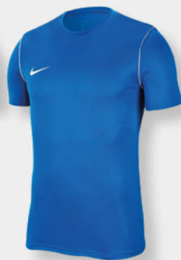
Erw. BV6883-463 Kids BV6905-463 Royal Blue / White / [White]