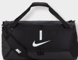
M CU8090-010 L CU8089-010 Black / Black / (White)