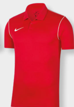
Erw. BV6879-657 University Red / White / [White]