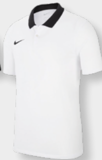
Erw. CW6933-100 White / Black / [Black]