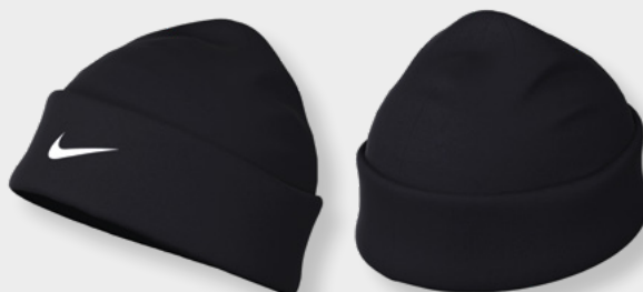
FQ8292-010 Black / (White)