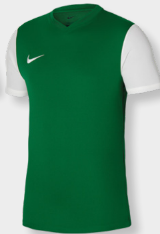
Erw. DH8035-302 Kids DH8389-302 Pine Green / Weiß / [Weiß]