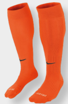
Erw. SX5728-816 Safety Orange / (Black)