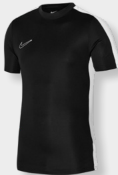
Erw. DR1336-010 Kids DR1343-010 Schwarz / Weiß / Weiß

ACADEMY 21 TRAINING TOP Herren Oberteil S-XXL € 24,99 Kinder Oberteil S-XL € 17,99