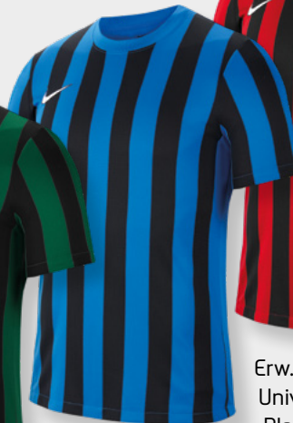
Erw. CW3813-463 Royal Blue / Black / (White)