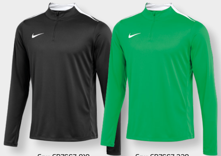
Erw. FD7667-010 Schwarz / (Weiß)