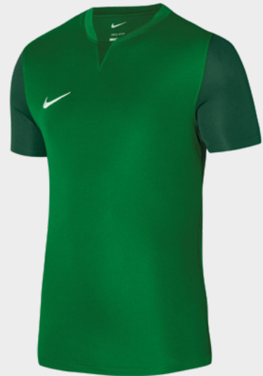
Erw. DR0933-302 Pine Green / Gorge Green / Gorge Green / (White)