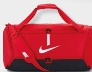
M CU8090-657 L CU8089-657 University Red / Black / (White)