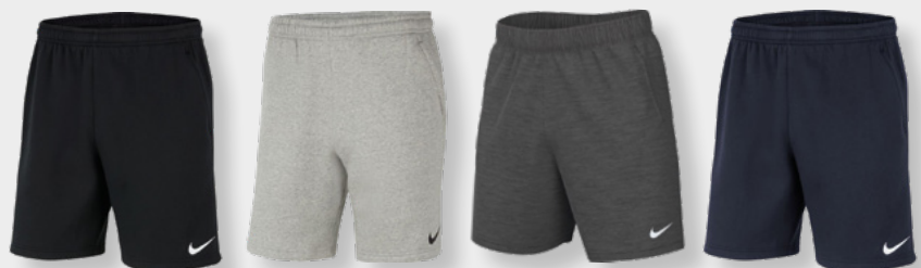
Erw. CW6910-010 Black / White / (White)