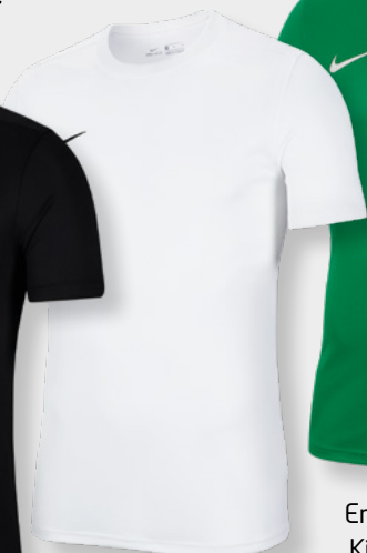
Erw. BV6708-100 Kids BV6741-100 White / [Black]