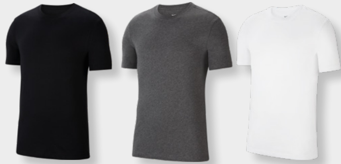
Erw. CZ0881-010 Kids CZ0909-010 Black / (White)