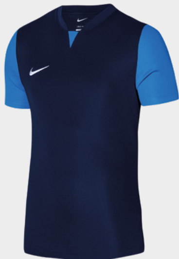
Erw. DR0933-410 Midnight Navy / Photo Blue / Photo Blue / (White)