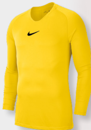
Erw. AV2609-719 Tour Yellow / (Schwarz)