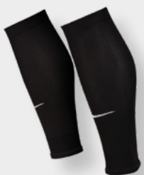
Erw. DH6621-010 Schwarz / (Weiß)