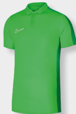
Erw. DR1346-329 Green Spark / Lucky Green / [White]