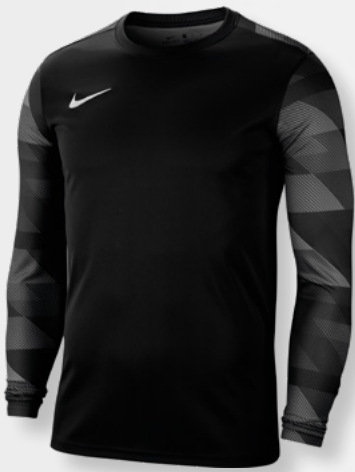
Erw. CJ6066-010 Kids CJ6072-010 Black / White / [White]