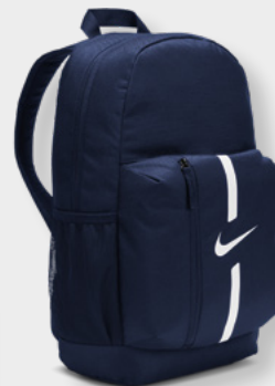
DA2571-411 Midnight Navy/ Black/White