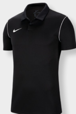
Erw. BV6879-010 Black / White / [White]