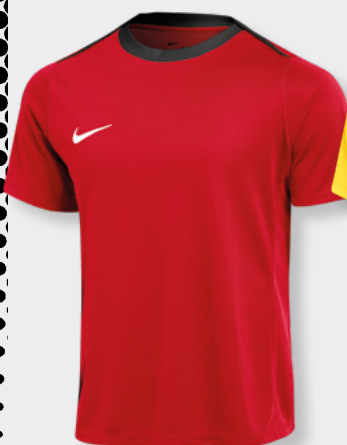
Erw. FD7592-657 University Red / Black / (Weiß)