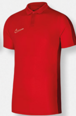
Erw. DR1346-657 University Red / Gym Red / [Weiß]