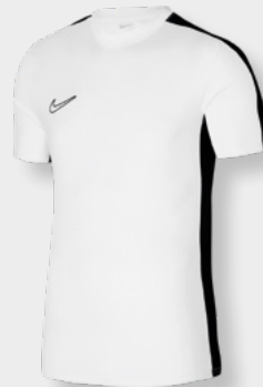
Erw. DR1336-100 Kids DR1343-100 Weiß / Schwarz / (Schwarz)