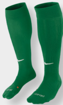
Erw. SX5728-302 Pine Green / (White)