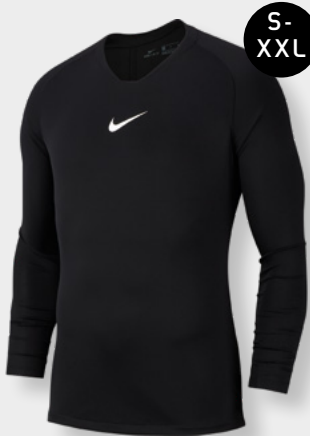
Erw. AV2609-010 Schwarz / (Weiß)