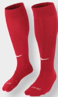
Erw. SX5728-648 University Red / (White)