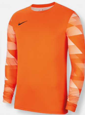
Erw. CJ6066-819 Kids CJ6072-819 Safety Orange / White / [Black]