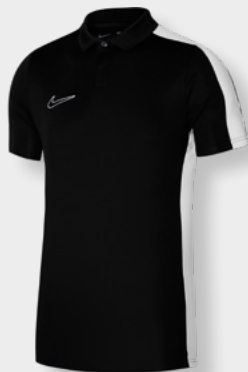
Erw. DR1346-010 Schwarz / Weiß / Weiß