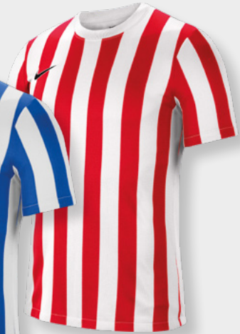
Erw. CW3813-104 White / University Red / (Black)