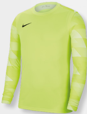
Erw. CJ6066-702 Kids CJ6072-702 Volt / White / [Black]