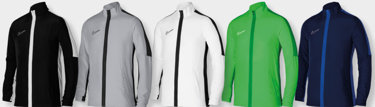
Erw. DR1710-010 Schwarz / Weiß / Weiß