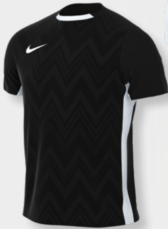
Erw. FD7412-010 Schwarz / Weiß / Weiß