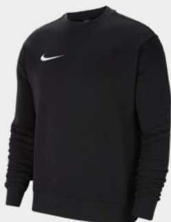
Erw. CW6902-010 Kids CW6904-010 Schwarz / [Weiß]