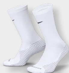
Erw. FZ8485-100 Weiß / (Schwarz)