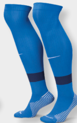
Erw. FQ8253-463 Royal Blue / Midnight Navy / White