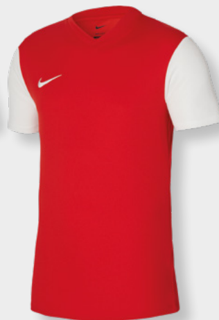
Erw. DH8035-657 Kids DH8389-657 University Red / Weiß / [Weiß]