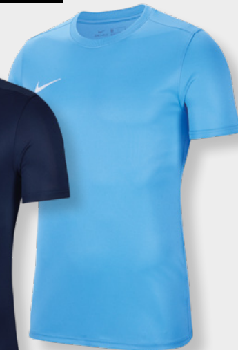
Erw. BV6708-412 Kids BV6741-412 University Blue / [White]