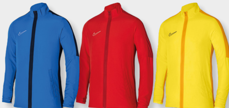
Erw. DR1710-463 Royal Blue / Obsidian / [Weiß]