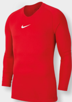
Erw. AV2609-657 University Red / (Weiß)