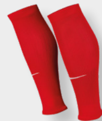
Erw. DH6621-657 University Red / (Weiß)