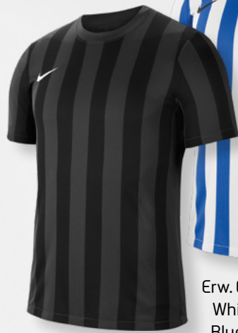
Erw. CW3813-060 Anthracite / Black / (White)