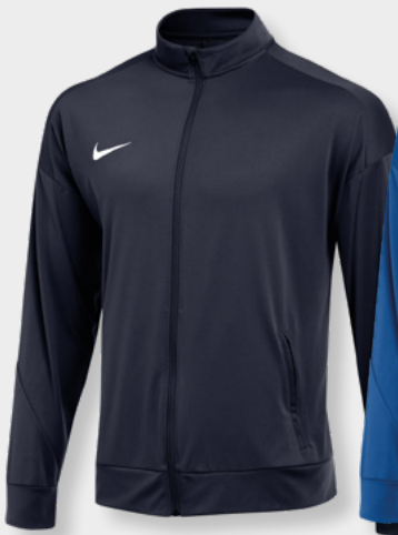
Erw. FD7681-455 Obsidian / (Weiß)