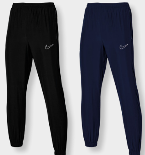
Erw. DR1725-010 Black / White / White / [White]