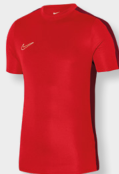
Erw. DR1336-657 Kids DR1343-657 University Red / Gym Red / (Weiß)