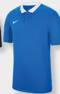
Erw. CW6933-463 Royal Blue / White / [White]