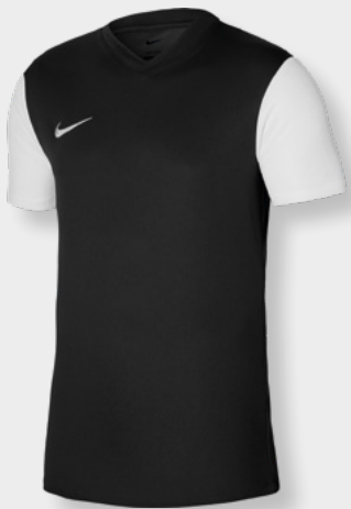
Erw. DH8035-010 Kids DH8389-010 Schwarz / Weiß / Weiß