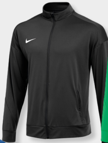
Erw. FD7681-010 Schwarz / (Weiß)