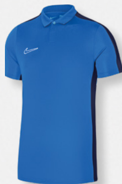
Erw. DR1346-463 Royal Blue / Obsidian / [Weiß]