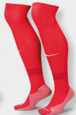
Erw. FQ8253-657 University Red / Gym Red / White