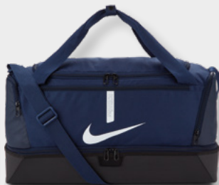
M CU8096-410 L CU8087-410 Midnight Navy / Black / (White)