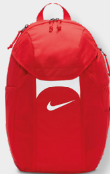
DV0761-657 University Red / Black / [White]