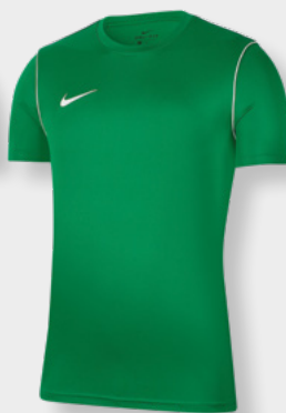
Erw. BV6883-302 Kids BV6905-302 Pine Green / White / [White]