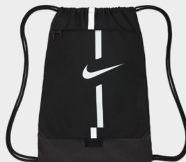
DA5435-010 Black / Black / (White)