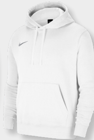
Erw. CW6894-101 White / White / [Wolf Grey]