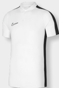
Erw. DR1346-100 Weiß / Schwarz / [Schwarz]