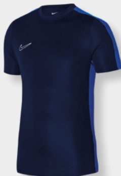
Erw. DR1336-451 Kids DR1343-451 Obsidian / Royal Blue / (Weiß)