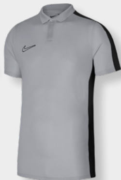
Erw. DR1346-012 Wolf Grey / Schwarz / Weiß