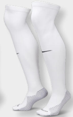
Erw. FQ8253-100 White / Black