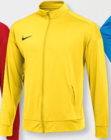
Erw. FD7681-719 Tour Yellow / (Schwarz)