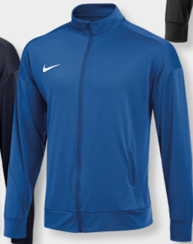
Erw. FD7681-468 Royal Blue / (Weiß)