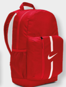
DA2571-657 University Red/ Black/White