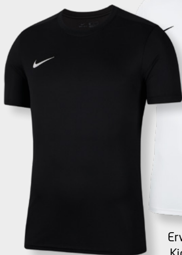
Erw. BV6708-010 Kids BV6741-010 Black / [White]