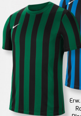
Erw. CW3813-302 Pine Green / Black / (White)