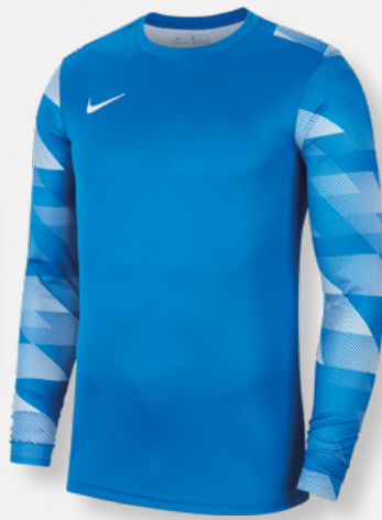
Erw. CJ6066-463 Kids CJ6072-463 Royal Blue / White / [White]