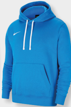
Erw. CW6894-463 Kids CW6896-463 Royal Blue / White / [White]