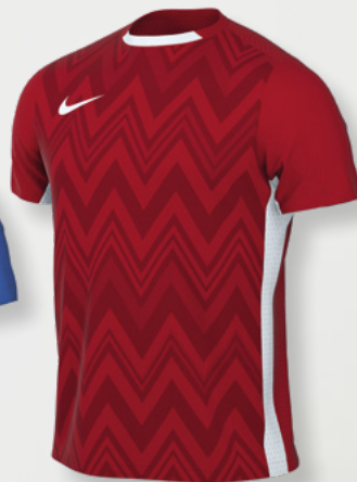
Erw. FD7412-657 University Red / Weiß / (Weiß)