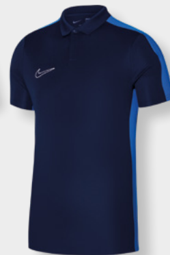
Erw. DR1346-451 Obsidian / Royal Blue / [Weiß]