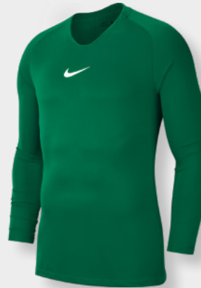
Erw. AV2609-302 Pine Green / (Weiß)