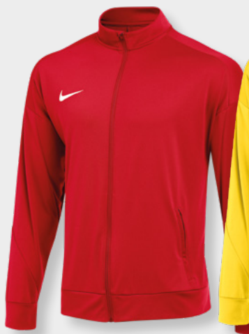
Erw. FD7681-657 University Red / (Weiß)