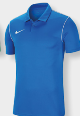
Erw. BV6879-463 Royal Blue / White / [White]