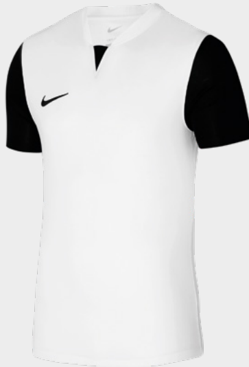
Erw. DR0933-100 Weiß / Schwarz / Schwarz / (Schwarz)