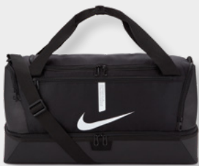
M CU8096-010 L CU8087-010 Black / Black / (White)