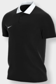
Erw. CW6933-010 Black / White / [White]