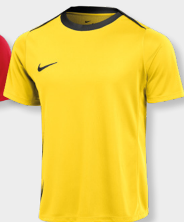
Erw. FD7592-719 Tour Yellow / (Black)